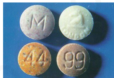
ภาพที่ 1.3 แอมเฟตามีน

2.1.2 ประเภทกระตุ้นประสาท ได้แก่ แอมเฟตามีน (ยาบ้า ยาฆ่า ยาขยัน) อีเฟดรีน (ยาไอ) โคคาอีน กระเทียม ฯลฯ ออกฤทธิ์ทำให้ตื่นตัว ไม่ง่วงนอน ผู้เสพยาจะมีอาการหงุดหงิด กระวนกระวาย จิตสับสน คลุ้มคลั่ง หวาดระแวง หรือมีอาการทางประสาท แต่เมื่อหมดฤทธิ์แล้วจะหมดแรง เกิดอาการตัวสั่น ตึงเครียดถึงกับหมดสติอาจถึงขั้นเสียชีวิตได้