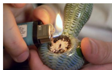
ภาพที่ 1.4 DMT

2.1.3 ประเภทหลอนประสาท ได้แก่ DMT LSD เห็ดขี้ควาย และสารระเหยต่างๆ เป็นต้น ออกฤทธิ์ทำให้เห็นภาพผิดปกติ รสสัมผัสแปรปรวน มีปฏิกิริยาผิดไปจากความเป็นจริงทั้งหมด พบว่าผู้เสพยาจะมีอาการประสาทหลอนทางตา หู จมูก และลิ้น ฝันเพื่อง หูแว่ว ได้ยินเสียงประหลาด หรือเห็นแสงสีและภาพหลอน