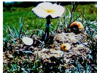
ภาพที่ 1.8 เห็ดขี้ควาย