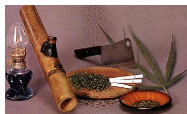
ภาพที่ 1.5 กัญชา

2.2.4 ประเภทออกฤทธิ์ผสมผสาน ซึ่งครั้งแรกจะกระตุ้นประสาท แต่เมื่อเสพมากขึ้นจะกดประสาท และทำให้ประสาทหลอนได้ ได้แก่ กัญชา กระเทียม เกิดอาการเห็นภาพลวงตา หูแว่ว มีอาการหวาดระแวง เป็นต้น