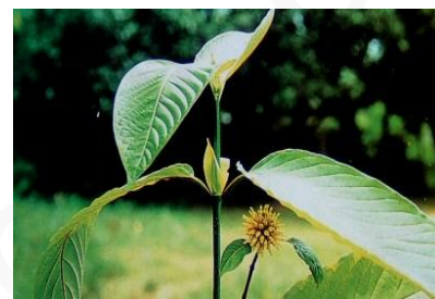
ภาพที่ 1.7 กระท่อม