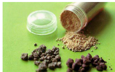
ภาพที่ 1.2 เฮโรอีน

2.1.1 ประเภทกดประสาท ได้แก่ กลุ่มฝิ่น (ฝิ่น มอร์ฟิน เฮโรอีน) ยาระงับประสาทและยานอนหลับ ยากล่อมประสาท เครื่องดื่มมีเมาทุกชนิด สารระเหย ประเภทต่างๆ เช่น ไดอะซีแพม แล็กเกอร์ ทินเนอร์ กาวคลอไดอะซีฟลูโอไรด์ และชนิดอื่นๆ เช่น โคเคอีน หรือโคคาอีน เป็นต้น ออกฤทธิ์ทำให้มีเมฆง่วงซึม และจนถึงขั้นหยุดหายใจ พบว่าผู้เสพยาจะมีร่างกายซูบซีด ผอมเหลือง อ่อนเพลีย ฟุ้งซ่าน บางครั้งอาจทำในสิ่งที่คนปกติไม่กล้าทำ เช่น ทำร้ายตนเองหรือผู้อื่น เป็นต้น