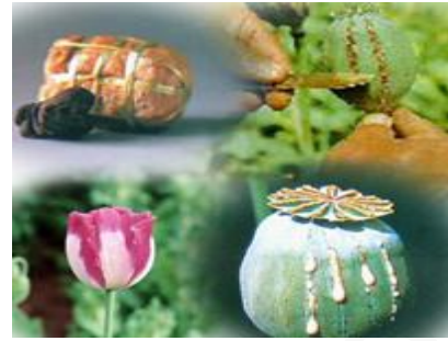
ภาพที่ 1.6 ฝิ่น

การติดสารเสพติดเป็นปัญหาทางสังคมที่สำคัญที่สุดในปัจจุบัน เนื่องจากการติดสารเสพติดจะทำให้ผู้เสพ มีความเสื่อมโทรมทั้งทางร่างกายและจิตใจ เกิดอาการทาง จิตประสาทที่เป็นสาเหตุของการก่ออาชญากรรมและเกิด อุบัติเหตุต่างๆ สร้างความเดือดร้อนทั้งแก่ตนเอง ครอบครัว และบุคคลอื่นๆ และทำให้ประเทศชาติ ต้องสูญเสียกำลังคนที่จะพัฒนาประเทศ