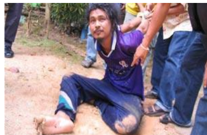
ภาพที่ 1.1 อาการลงแดงและคลื่นคลั่งเมื่อขาดสารเสพติด